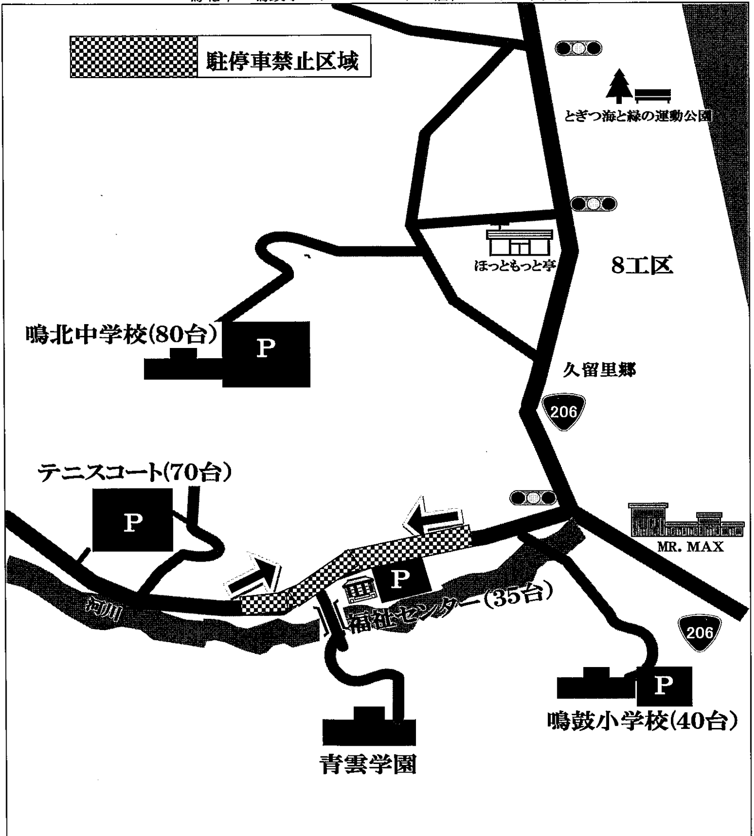
地図 1 通学生保護者駐車場 鳴北中・鳴鼓小・テニスコート・福祉センター周辺図